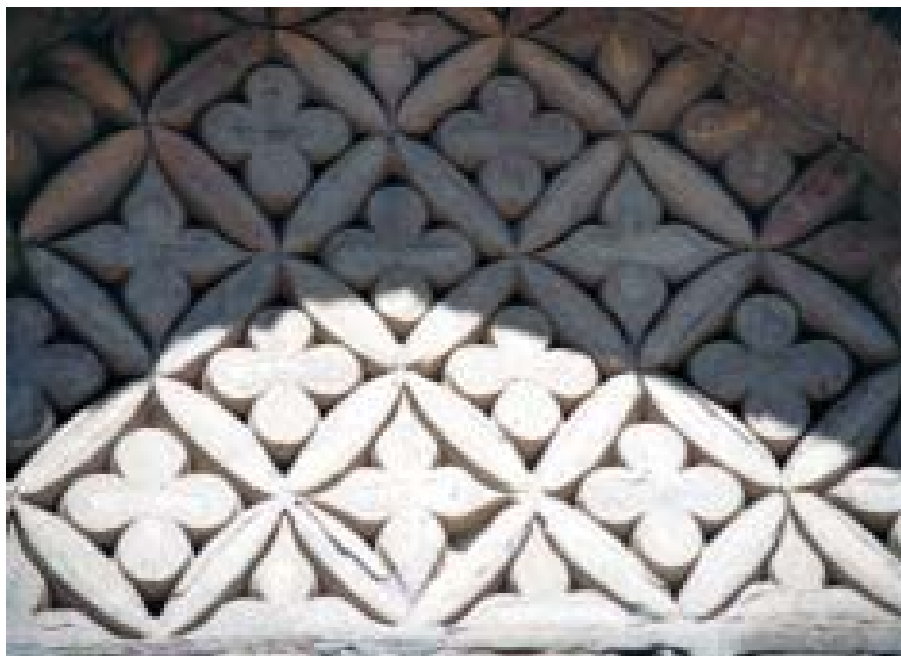
Architectural decor of the Samanid mausoleum Фрагмент архитектурного декора мавзолея

Памятник знаменует начало новой эпохи в развитии среднеазиатского зодчества, возрожденного после арабского завоевания. Очевидно, в ту пору на узбекской земле продолжали развиваться древние традиции, но уже в новом качестве: техника строительства — из жженого кирпича, ее конструктивные и художественные возможности, средства архитектурной выразительности являются заслугой нового времени, хотя еще и несут в себе “знаковую систему” доисламской культуры.