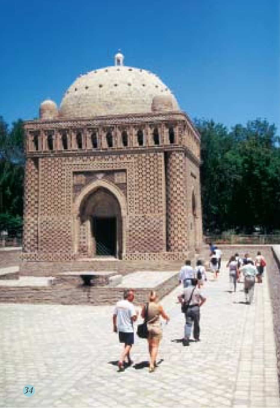
The popular Samanid mausoleum, Bukhara У мавзолея Саманидов всегда много туристов

Now, completely restored, it is situated in Samani Park, a five-minute walk due west of the Registan. The construction is of a 10.8 metre cube with four identical facades decorated with columns, leaning towards the inside forming a dome surrounded by four smaller domes. The overall effect is refreshingly simple.