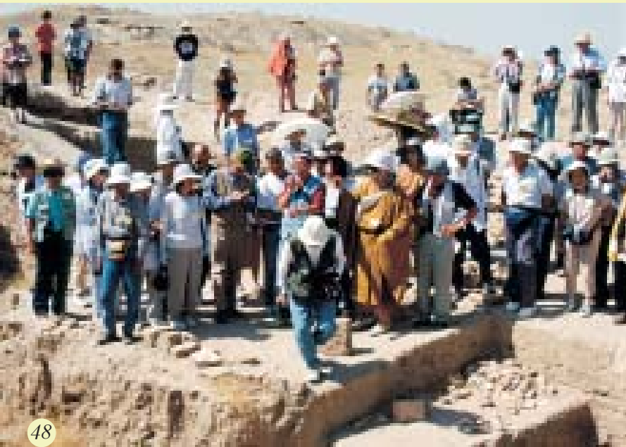
Japanese view excavations, Buddhist Temple, Kara Tapa

Hidden treasures and gold were discovered amongst the Dalvarzin diggings in 1972. About 100 articles of gold including pendants, large bracelets,