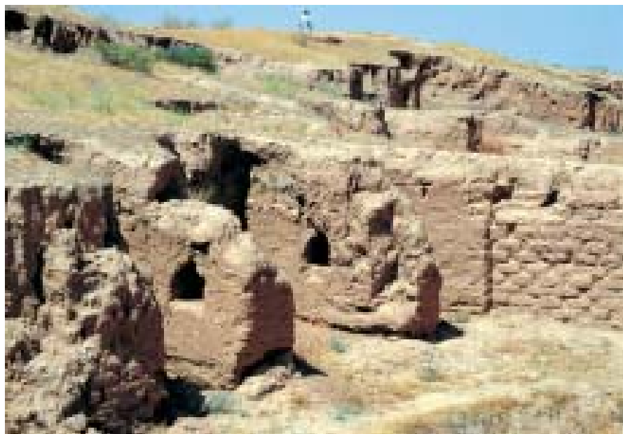
Excavations of Buddhist constructions, Kara Tepa Раскопки одного из буддийских сооружений на Каратепа

Открытия археологических экспедиций привели на Дальварзинтепа многих зарубежных ученых. Сейчас здесь работает совместная археологическая экспедиция узбекского Института