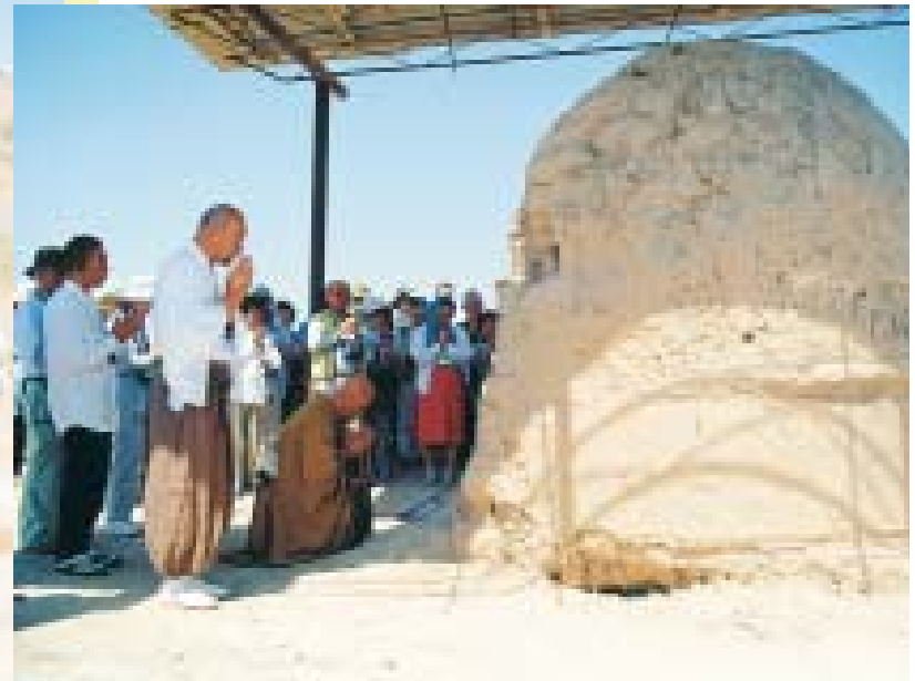
Japanese Buddhist monk at excavations, near Termez Служитель одного из буддийских храмов Японии на раскопках под Термезом

rings and other unfinished trinkets in a ceramic vessel were unearthed and have been classified as genuine. This discovery, weighing 36 kg, was dated back to the latter part of the 2nd century AD.