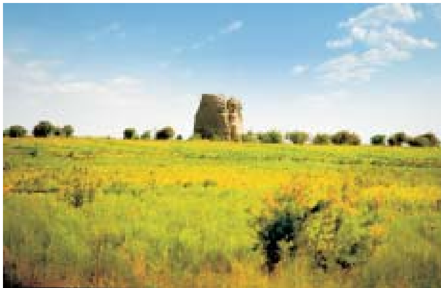
Buddhist Stupa Zurmala, Termez district Буддийская ступа — Башня Зурмала под Термезом

В 629–645 годах н.э. через Центральную Азию по пути в Индию прошел китайский путешественник, буддийский монах Сюань Цзян (Санзо Хоши). Это было время, когда дипломатический и торговый, культурный и духовный обмен между Китаем и Центральной Азией достиг своего апогея. Сведения об этом странствии буддийский паломник собрал в своей книге “Да Тянь Си Юнь Цзи” (Записки о путешествии по западным территориям во времена правления в Китае династии Великого Тяня). Сюань Цзян рассказал в ней китайцам и японцам о процветающей стране Согд, его столице Самарканде, сообщил о Чаче