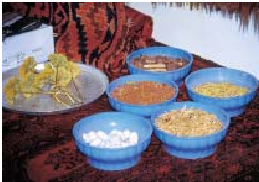
Only natural dyes are used in threads Только естественные красители используются для окраски пряжи

Работа над одним ковром может длиться от 6 до 12 месяцев, ведь плотность плетения очень высока: в узоре каждого изделия надо соединить сотни тысяч, а то и более миллиона узлов на каждом квадратном метре.